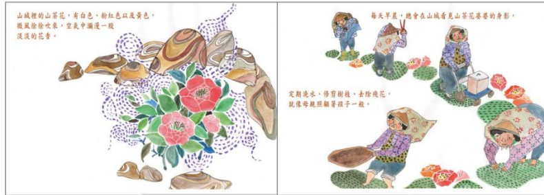
※範例作品：教育部反毒繪本—山茶花婆婆/洪孟真、呂舒婷