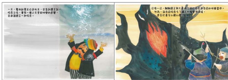
※範例作品：教育部反毒繪本—飄飄王國滅亡記/洪孟真、呂舒婷